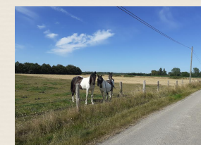
Campagne gennevillaise (7)