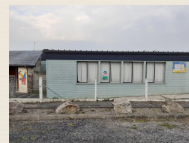
L'école maternelle (1)

Vous pouvez admirer un ancien porche (9) avant de tourner à gauche sur le Chemin de l'église pour rejoindre le bourg. Ce porche a été construit en damiers de travertins et de briques et permettaient autrefois le passage des attelages et celui des piétons. Ce domaine appartient à la même famille depuis 1771 ainsi que la statue de la Vierge.