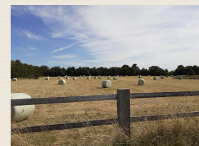
Campagne gennevillaise (6)