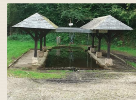
Lavoir Fontaine Goubart (4)