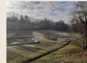
Le Lagunage (2)