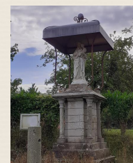
Statue de la Vierge (8)