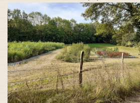
et ses trois étangs (3)