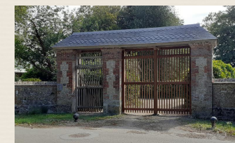
Ancien Porche (9)